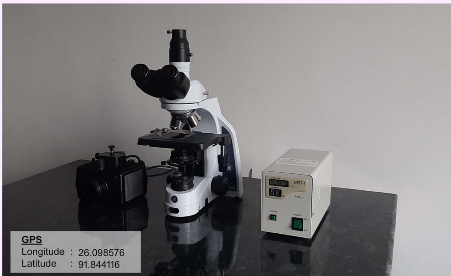
Gel Documentation System