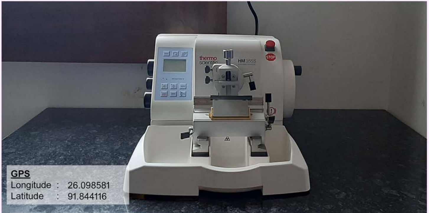
Automated Rotary Microtome